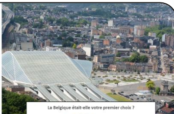
La Belgique était-elle votre premier choix ?